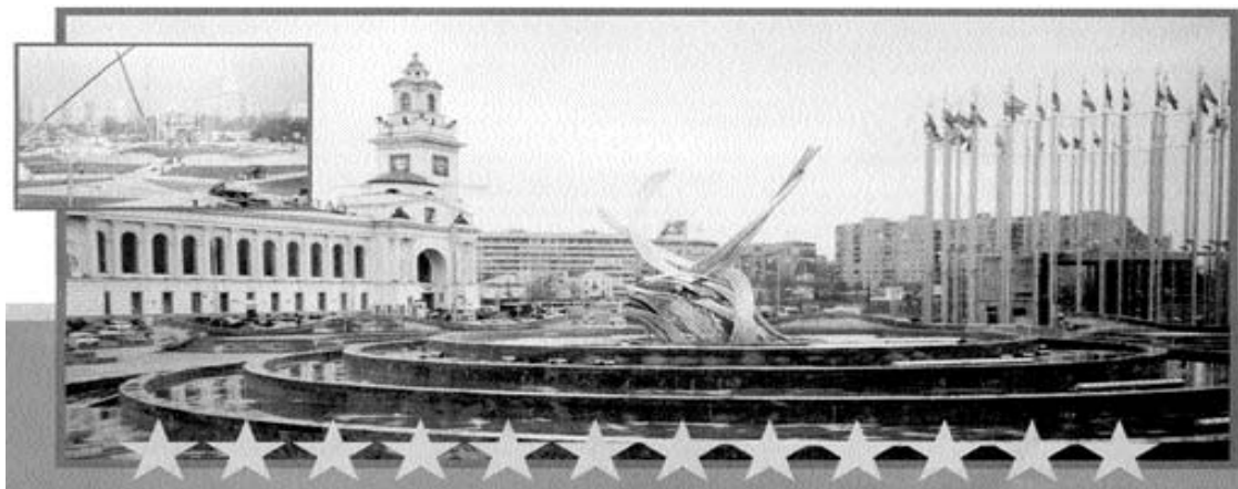
Абстрактная скульптура “Женщина на звере”, подаренная Брюсселем городу Москве. Площадь Европы

Если посмотреть на события 2000-летней давности, то мы увидим, что в то время, когда родился Иисус, Израиль находился во власти римлян. Это был период расцвета могущества Римской империи. Однако в 395 году империя была разделена на восточную и западную провинции, которые пали в 5 столетии от германских завоевателей. Демонический дух, присущий Римской империи, не был устранен - средневековая Европа, кото-