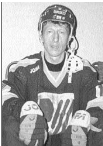
Виктор Екимов, чемпион России по хоккею с мячом

"Ибо всякая плоть - как трава, и всякая слава человеческая - как цвет на траве: засохла трава, и цвет ее опал; но слово Господне пребывает вовек..." (1 Петра 1:24).